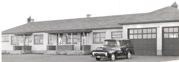
Hôtel de ville - Ville de Forestville - 1957

C'est le 4 mai 1944 que le gouvernement du Québec permet l'incorporation de la Ville de Forestville. Venez visiter notre exposition exclusive sur les 75 ans de Forestville. Plusieurs photos y sont présentées.