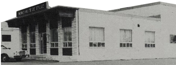
Hôtel de ville - Municipalité St-Luc - 1975